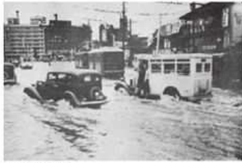
室戸台風 昭和9年9月21日

北区 大阪駅前 大阪駅周辺にあふれた水は、激しい流れとなり、交通に支障をきたした。