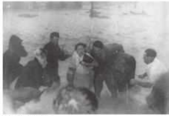
ジェーン台風 昭和25年9月3日

港区 築港付近 迫り来る高潮。一刻を争う緊張の中で消防署員による救出が続けられた。