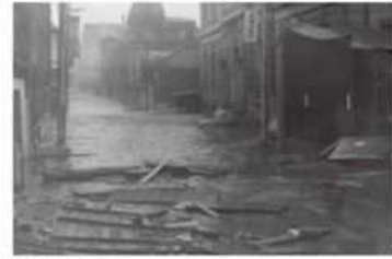
第2室戸台風 昭和36年9月16日