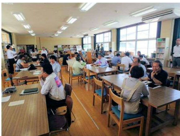
西原村相談会の様子（6月11日午前）

技術士は地盤や土砂災害を専門とする人が参加しましたが、一緒に相談に乗る士業は、建築士と不動産鑑定士であることが多かったと思います。これらの士業とは日ごろから連携を深めておくことが大切だと思います。