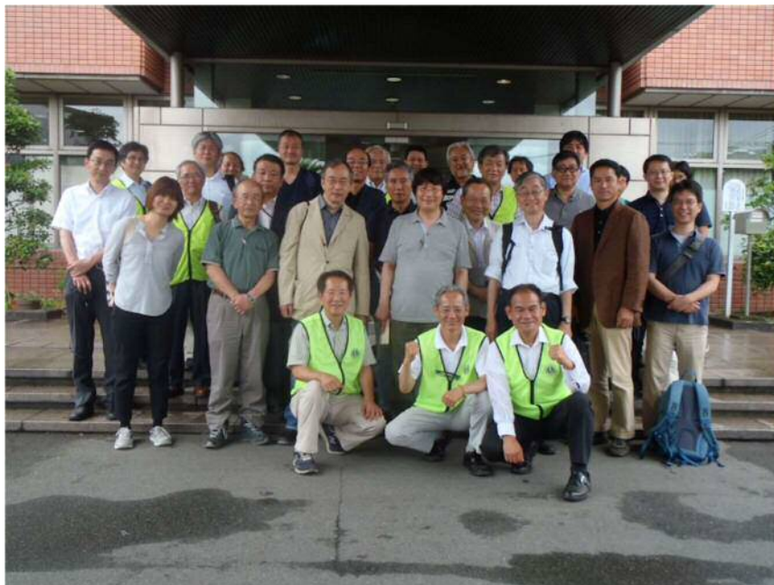
ワンパック相談会に参加した専門士業と御船町のかた(前の3名)。弁護士、税理士、不動産鑑定士、土地家屋調査士、司法書士、行政書士、技術士、建築士の8業種