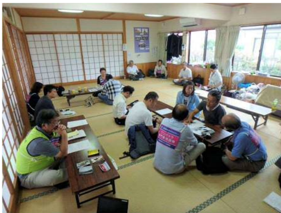
益城町馬水公民館会場（南側地区）

11日の午前の相談会は、西原村大切畑地区の集落の方が来られました。区長さんから全体的な説明を聞いたあとで、個別の相談会に入りました。西原村では、技術士が担当した相談は1件のみでした。地震で家の裏の擁壁が傾き、斜面上方の家屋の宅地にクラックが入ったが危険はないか、どう対処したらよいか？という相談でした。県の急傾斜地崩壊防止対策として施工された擁壁でしたので、県の砂防課に連絡して現地を見てもらうようにとお答えしました。