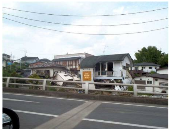
益城町内（6月11日昼頃）

11日午後は、非常に家屋被害が顕著だった益城町でした。北側の地区と南側の地区に分かれて相談会を行いました。近畿本部の技術士は南側を担当しました。