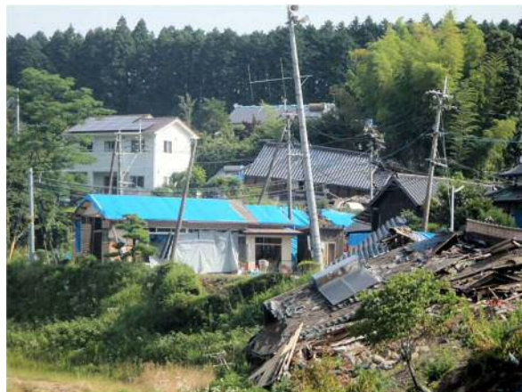
西原村大切畑地区（6月11日朝）