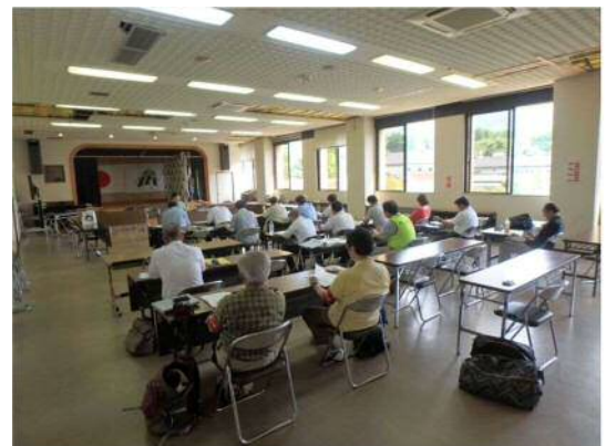
南阿蘇村役場でのヒアリング (天井板が落ちている)

参加専門家 弁護士 5 名 税理士 5 名 不動産鑑定士 7 名 土地家屋調査士 3 名 司法書士 2 名 行政書士 2 名 技術士 5 名（近畿本部 2 名、九州本部 3 名） 建築士 2 名