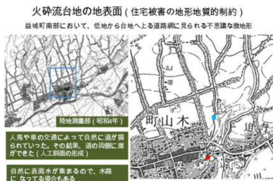
益城町の馬車道 (京大防災研釜井教授の資料)

益城町の震災の帯の下に断層が存在しているのではないかと、そういう場所は危険地区に指定して集団移転したほうが良いのではないかと相談される方もいらっしゃいました。