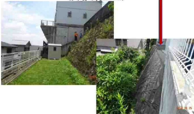
擁壁新築後の新耐震建築(建物被害無し) 擁壁前面の以前のブロック積は全面的傾斜あり (天端で約20mm)