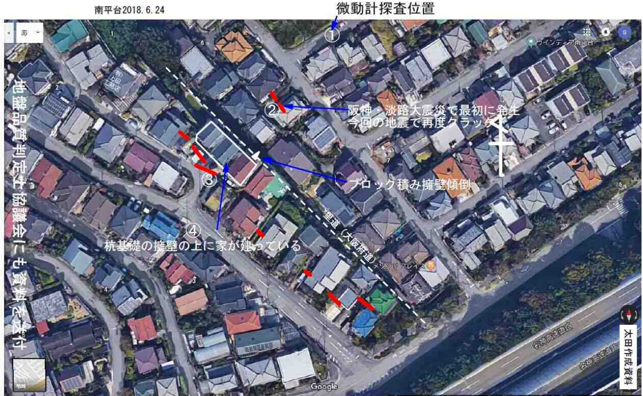
赤い線がクラック位置（切盛り境界付近に連続している）

被災直後の混沌としたときには、専門家が役に立てる場面はいろいろありそうだ、というのが今回の現地調査でわかったことです。