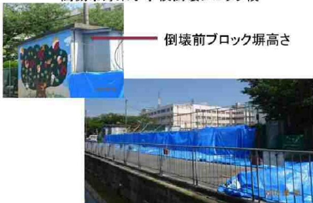
倒壊前ブロック塀高さ