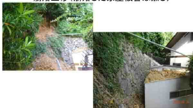
崩落土砂(崩落した家屋被害は無し)