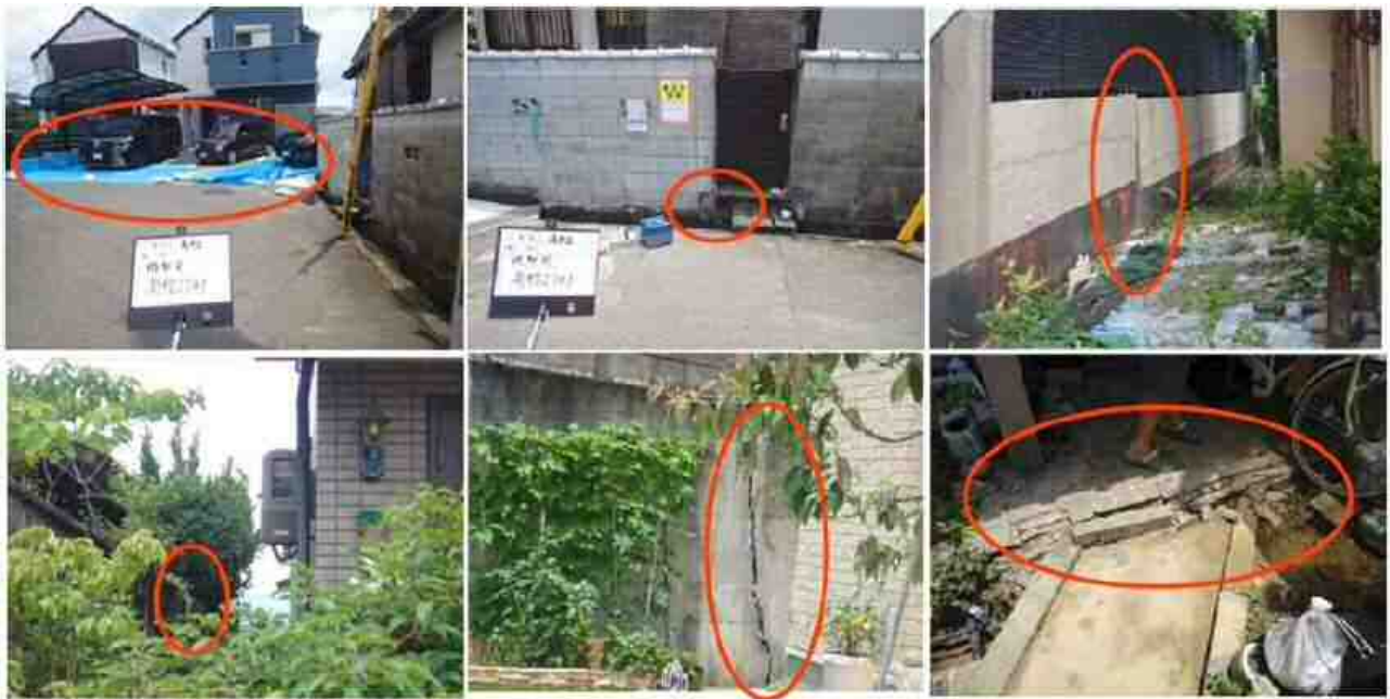
北西から南東方向に向かって地盤のクラック・段差を順番に並べた。切盛り境界付近に連続してクラックが発生している。