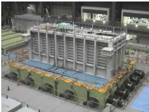
前日に実施された振動台実験

当初計画では、地盤の側方流動による矢板護岸とその背後の建物基礎杭の地震時破壊実験を見学する予定で当初25名の参加申込がありました。しかし、振動台実験が前日の23日（木）に変更になり、かつ一般公開の形で行われることになったため、今回の見学会は10名の参加となりました。