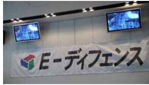
ビデオで施設の概要説明

なおこの施設での公開実験の映像は、ホームページで公開されていますので、ご覧下さい。