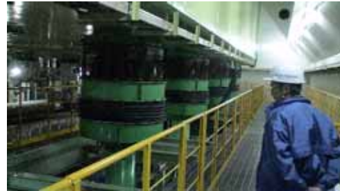
振動台の下にある設備見学