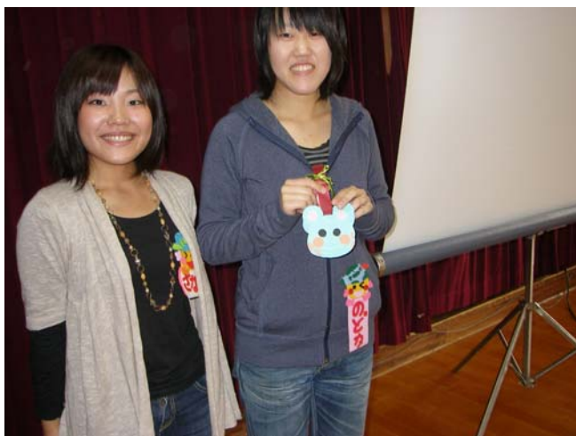
プレゼントの 「ちゅーたのメダル」