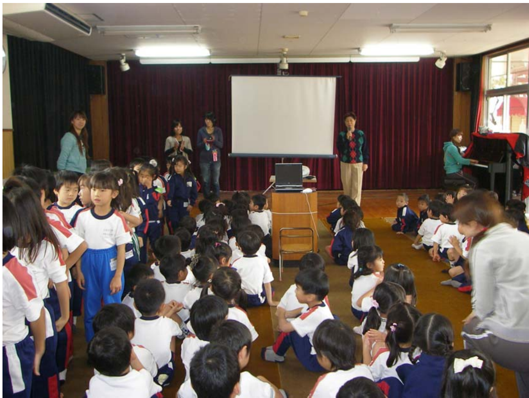
園長先生の終わりの挨拶